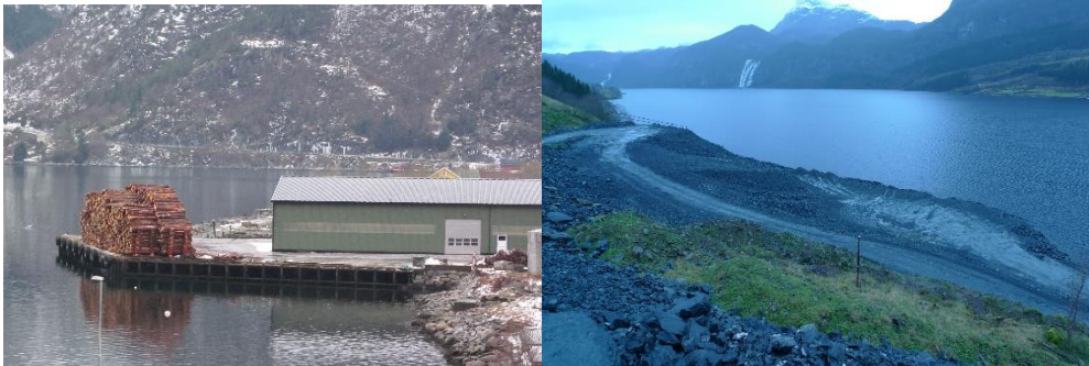
Vadheim tømmerkai, t.h. Kvamen i Dalsfjorden.

I Vadheim (bilde til venstre) i Høyanger kommune ligger det en kai som har vært brukt til utskipping av tømmer i flere tiår. På 1990 tallet ble det bygd en ny tømmerkai (via oreigning) på for denne relativt tunge skogregionen i Sunnfjord på Bjørvikstranda i Gaular kommune (nabokommune til Høyanger). Etter at kaien var tatt i bruk engasjerte grunneier sak mot kommunen og ville ha kaien fjernet. Etter flere år med saksgang i retten, ble kommunen dømt for å gjort et vedtak om oreigning på feil grunnlag. Etter det vi kjenner til via media har staten v/ Landbruksdepartementet gitt grunneier en relativt stor erstatning for å rive kaien. Kaien er