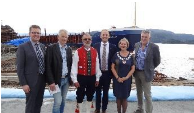
Åpning av Eidsnes tømmerkai i Lindås høsten 2016.

Eidsnes tømmerkai i Lindås eies av Nordhordland Skogeigarlag. De fikk tilsagn om statstilskudd til en utbygging i 2013 (ca. 7 mill. kr) og i 2014 (ca. 8 mill. kr), totalt 15,214 mill. kroner.