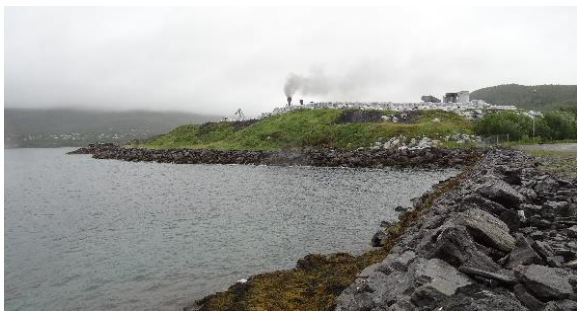
Deler av bakarealet ved Finnsnes regionhavn i Lenvik. Finnfjord ferrosilisiumverk i bakgrunnen.

Finnsnes regionhavn i Lenvik kommune i Troms fikk i 2015 et tilskudd på inntil 3,5 mill. kroner. Totale investeringskostnader er beregnet til 11 mill. kroner. Tilskuddsmidlene skal brukes til oppgradering av et lagerareal på 12 dekar med nær tilknytning til kaifronten ved havna. Tømmerterminalen vil dekke kommunene Tranøy, Lenvik, Sørreisa, Dyrøy, Målselv og Bardu. På samme industriområde ligger Finnfjord AS, et ferrosilisiumverk som bruker treflis som reduksjonsmateriale fremfor kull og koks.