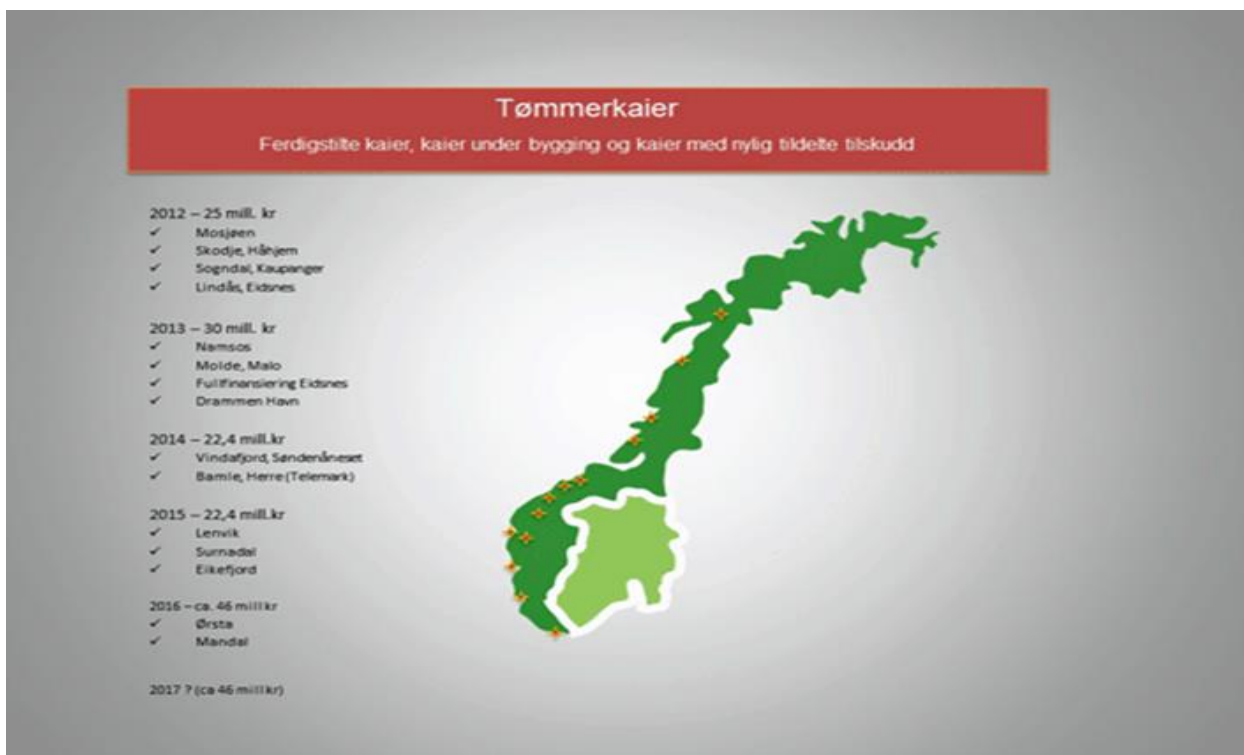
Figur 1. Ferdigstilte kaier, kaier under bygging og kaier med nylig tildelte tilskud