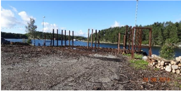
Utbjoa tømmerkai i Vindafjord.

Det er Vindafjord Skogeigarlag som eier kaien på Utbjoa som ligger i Vindafjord kommune. De siste årene har det gått mellom 7000 og 9000 m 3 /år over kaien. Vindafjord Skogeierlag mener det er potensiale til å øke den årlig omsetningen over kaia til mellom 20 000 og 30 000 m 3 . Dette fordi kaien på Dommersnes (10 000 m 3 /år) er leid vekk til annen aktivitet, og Søndenåneset vil også bli nytt til mye tømmer fra Suldal etter at det er bygd bro over fjorden. Dekningsområde er ifølge skogeierlaget Vindafjord, Tysvær, Bokn, Haugesund, Etne og Svei kommuner.