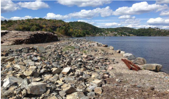
Utbyggingsområde ved Herre tømmerkai i Bamle.

Tømmerkaiene i Herre i Bamle og Drammen i Buskerud ble også finansiert 2014. Disse tømmerkaiene ligger ikke i kystskogfylkene men prosjektleder har deltatt på orienteringsmøte om Drammen Havn.