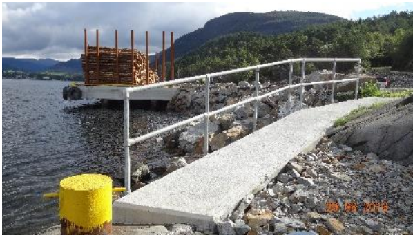
Søndenåneset tømmerkai er ferdigstilt.

Eier av tømmerkaia på Søndenåneset er Vestskog SA og de fikk i 2015 tilsagn om tilskudd på inntil 5,9 mill. kroner. Totale investeringer var da beregnet til 7,44 mill. kroner.