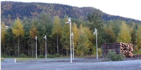
Fotomålestasjonen for tømmerlike utenfor Orkanger Havn.

Det er Trondheim Havn som eier og drifter havna på Orkanger i Sør-Trøndelag. Skogbruket har benyttet denne havna i mange år og vilkårene har vært gode. Det er søkt Landbruksdirektoratet om tilskudd. Undertegnede har ikke vært trekt inn i denne saken og kjenner den pr. dato ikke. Det er planer om et møte før jul.