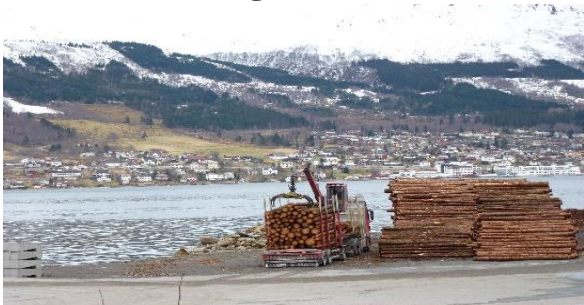
Aktuelt område for forlenging av Ørstaterminalen.

Sintef-rapporten «Transport av skogvirke i kyststrøk» (2011) prioriterte en tømmerkai Volda som er nabokommunen til Ørsta. Det har vært vurdert ulike løsninger i hele regionen, men