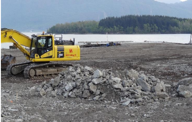
Håhjem i Skodje under anleggsarbeidet i 2015

Allskog er eier av Håhjem tømmerkai. Denne tømmerkaien fikk statstilskudd i 2013. Arbeidet startet opp i 2014 og ble slutført i 2015. Arbeidet gjelder forsterkning og asfaltering av bakareal. Bakarealet på ca. 10 dekar er avretta og komprimert med grus og deretter er det lagt asfalt, kvalitet AP, 5 cm/ 7 cm. Kaifronten er som før, ca. 30 meter lang og dybde (LAT) ca. 7 meter. Det er også utarbeidet en bruksavtale som ble tinglyst 6. februar 2015.