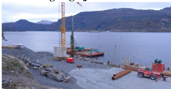
Eikefjord tømmerkai under utbygging.

Eikefjord tømmerkai i Flora kommune ble prioritert for statstilskudd ved tildeling i 2015. Flora Skogeigarlag er eier av tømmerkaien og har fått tilsagn om tilskudd på inntil 14,5 mill. kroner. Totale investeringskostnader er beregnet til 18,4 mill. kroner. Tilskuddet skal brukes til å utvide kaifronten fra 52 til 100 meter. Det skal mudres i østenden av kaia for å oppnå tilstrekkelig dybde langs kaifronten. Veien inn til kaianlegget skal også utbedres.