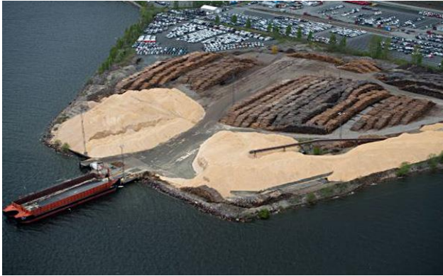
Lierstranda i Drammen.

Kaia i Drammen prosjekteres til å kunne ta unna 1,1 mill. m 3 i året.