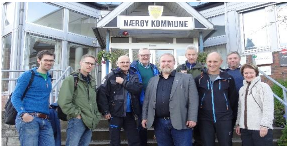
Deltakere i møte om tømmerkai på Kolvereid i Nærøy kommune.

Sintef-rapporten «Transport av skogvirke i kyststrøk» (2011) prioriterte en tømmerkai i Vikna