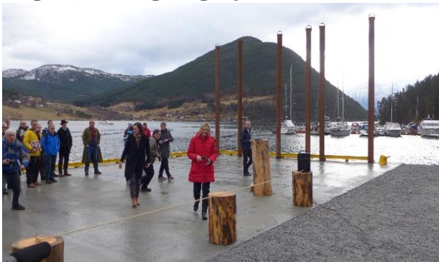
Tidligere landbruks- og matminister Sylvi Listhaug åpnet Kaupanger tømmerkai våren 2015.

Tømmerkaien i Kaupanger i Sogndal kommune fikk statstilskudd for utbygging i 2013. Det var Sogn og Fjordane Skogeierlag som eide den gamle kaien, - i dag er de fusjonert med Vestskog. Det ble først vurdert en trekailøsning. Dette ble skrinlagt og planene for en trekai