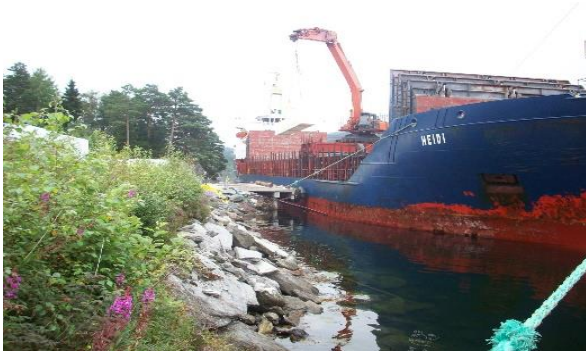
Liten tømmerkai i Holmefjord, Fusa.

Sintef-rapporten og Infrastrukturprogrammet pekte på en tømmerkai i Samnanger (nabokommunen til Fusa). Det er i dag en tømmerkai i Eikelandsosen (Fusa kommune). Denne kaien ligg i sentrum med de ulemper dette medfører, - i tillegg er den for liten. Så vel kommunen som skognæringa (Vestskog) har prioritert utbygging av en ny tømmerkai i denne regionen.