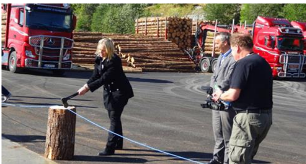
Foto: Tidligere landbruks- og matminister Sylvi Listhaug åpner Malo Tømmerkai 1. september 2016.