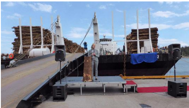
20.08.15 Daværende landbruks- og matminister Sylvi Listhaug åpnet og døpte skogplattformen Frøya på Bømlo i Hordaland.

Skogen i kystskogfylkene har relativt kort veg til sjø. Et stadig økende hogstkvantum sammen med en miljøvennlig og kostnadseffektiv transport på sjø, gjør denne flytende arbeidsplattforma til en spennende driftsform i skogbruket for fremtiden.