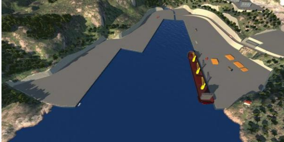
Strømsvika ved Mandal.

Mandal havn, Gismerøya er i dag den viktigste havna for utskipping av tømmer i Vest-Agder. Det skipes i dag ut i overkant av 170 000 m 3 tømmer som er levert av skogeiere fra kommunene i Lindesnesregionen (Mandal, Lindesnes, Marnardal, Audnedal og Åseral). Utskipingen er i dag lite rasjonell og kostbar for skognæringen fordi det er nødvendig med omlastning. Tømmertransporten er også konfliktfylt på grunn av trafikken som må gå gjennom bystrøk i Mandal. Dette betyr at over 4000 tømmertransporter i året må gå gjennom sentrumsdeler av Mandal by.