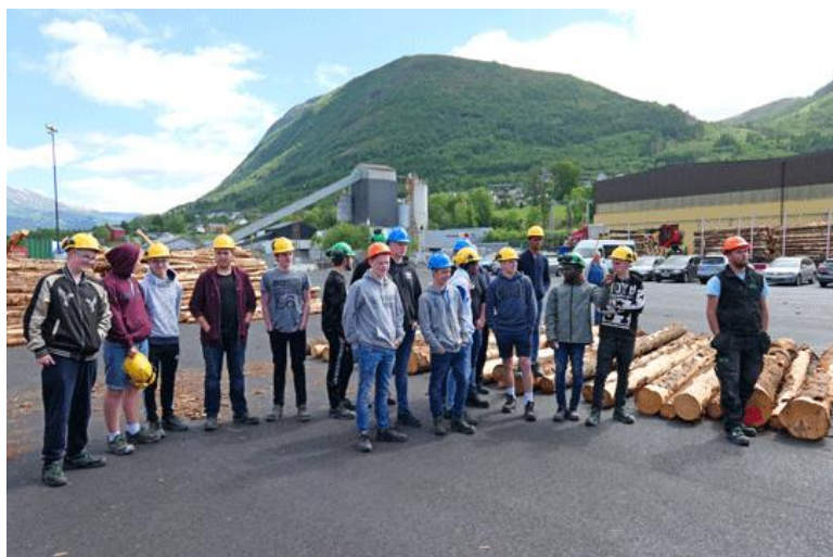
Bygg og Anlegg ved Ørsta vidaregåande skole i Volda møtte opp da Georg Dale åpnet Ørsta Tømmerkai juni 2018.

Dette gir en sum på 1 235 årsverk perioden. Noen av tallene er sikkert overvurdert, og andre undervurdert, men det er ingen tvil om at aktivitetene har gitt en betydelig sysselsettingseffekt. Mest interessant er grunnlaget som er lagt for varige verdiskapende arbeidsplasser framover.