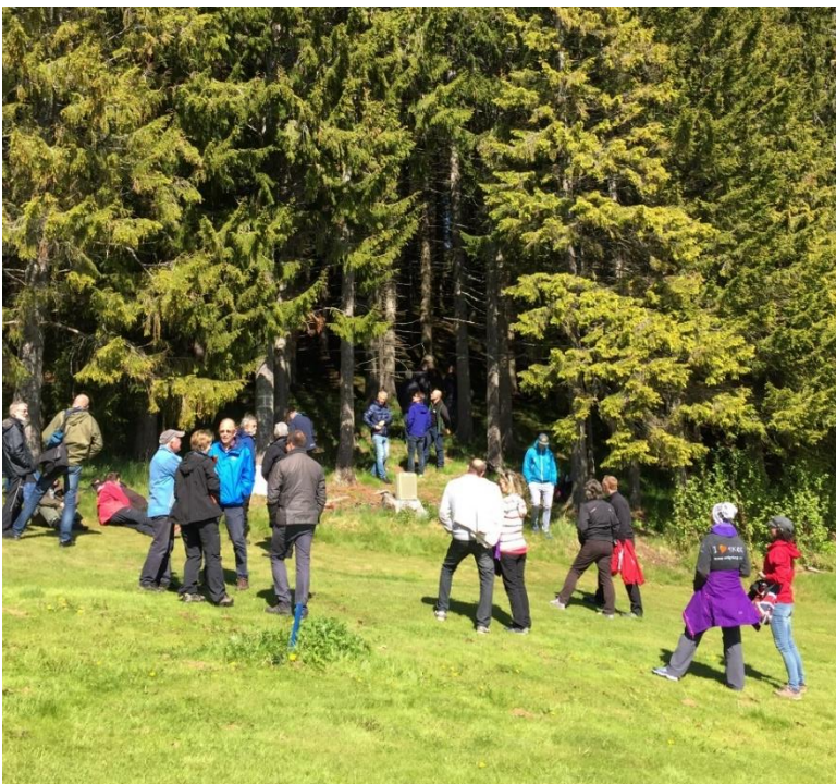
Bildet er fra Kystskogkonferansen 2016 som ble avholdt i Harstad.