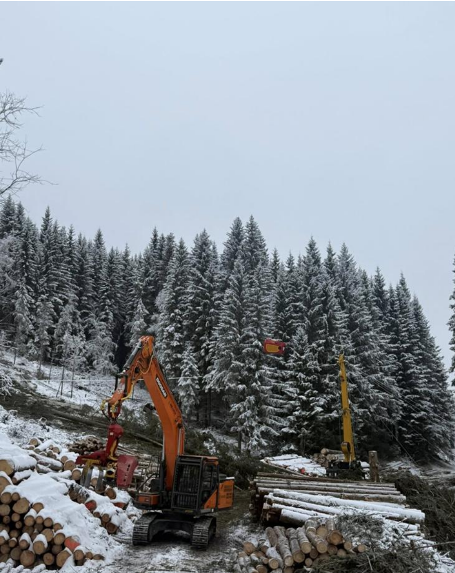
Bilde Skog& Bio