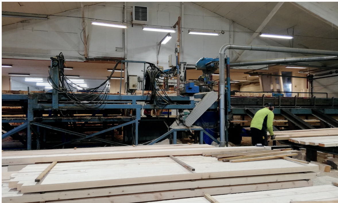
Bøfjorden Sag ved besøk i 2019.

Planer videre: Vi fortsetter arbeidet med å arrangere og delta på kompetansehevende samlinger for aktuelle utbyggere som kan bruke treløsninger, og aktuelle aktører for etablering av skogindustri.