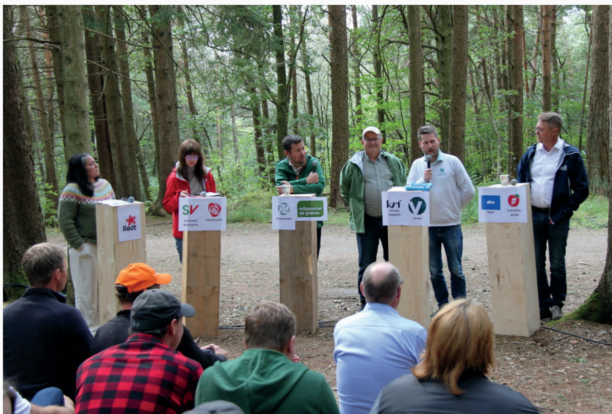
Representanter fra seks partier stilte til debatt om skogbruket i Sørmarka i Stavanger.

Arbeidet med sekretærforumet i Skognæringa Kyst har ligget noe på vent, men det kan være hensiktsmessig å ta det opp igjen i 2026. Faste møter blant sekretærene vil kunne bidra til bedre samordning, erfaringsdeling og et tettere samarbeid mellom nettverka. I januar 2025 ble det avholdt et felles trepartsmøte på Gardermoen, og i juni 2025 gikk Kystskogkonferansen i Trøndelag av stabelen. Arbeidet med årlige trepartsmøter videreføres, samt oppfølging av interessentanalysene i samarbeid med de fylkesvise skognettverkene. De månedlige nettverksmøtene har blitt avholdt som planlagt.